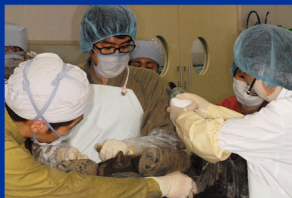
学生とともに病理解剖しているところ（ゾウガメ）