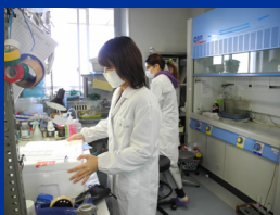
解析用のサンプルの処理をしているところ